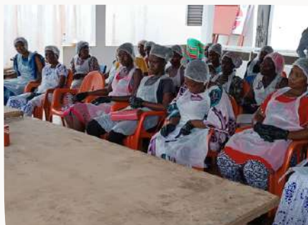
Séance de formation