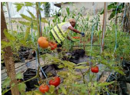
Site de production

LE PROJET À CIBLÉ 60 BÉNÉFICIAIRES ET A VU LA PARTICIPATION DE 90% DE FEMMES